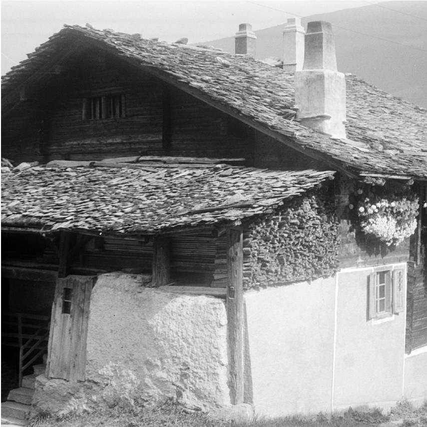
Ina chasa dubla a Caltgadira sur Trun, enturn il 1950. L’entrada è da la vart sura tras la bargia (IDRG C, 05.005.039, retragl)