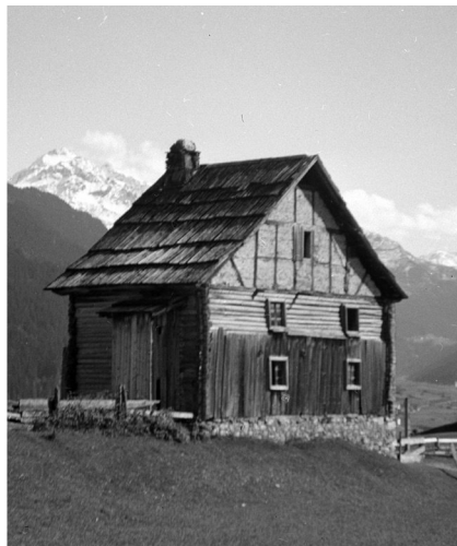
Ina chasa tranter vitg e baselgia a Salouf cun fatschadas fitg differentas, enturn il 1950