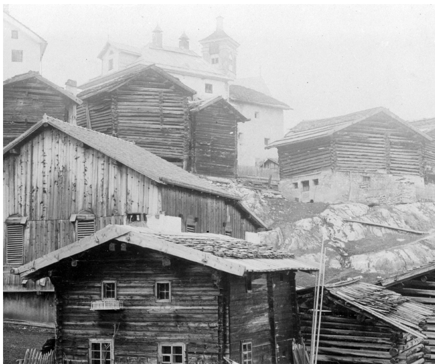
Davantvart dus tetgs da schlondas a Stierva (IDRG C, 05.101.001, retagl)